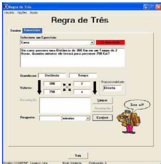
Figura 3 Jogo Regra de Três.

2.2.1) A Figura 3 ilustra a imagem do jogo Regra de Três (URI)