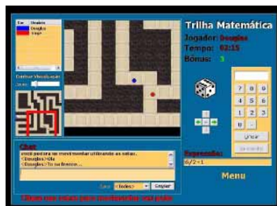
Figura 5 Jogo da Trilha Matemática, com IA

A Figura 5 apresenta Figura 5 – Jogo com IA, Trilha Matemática