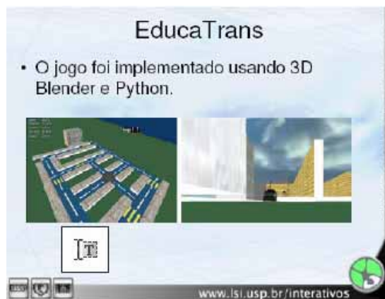
Figura 1 Jogo EducaTrans (fonte: Cinted/UFRGS).

– O EducaTrans apresenta um nível de interatividade média.