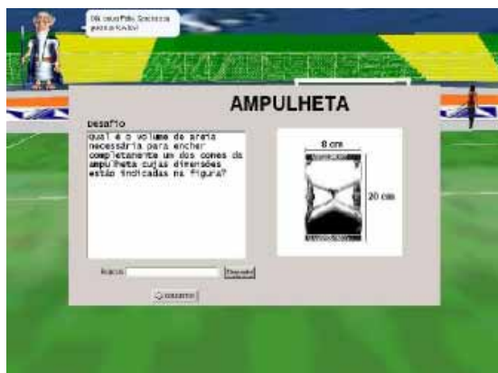
Figura 4 Jogo Educacional Agente Félix.

2.2.2) A Figura 4 ilustra o jogo Agente Félix, também desenvolvido com inteligência artificial (URI).